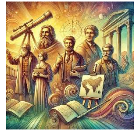
Image créée par Chat GPT

La Section Beauce-Etchemin a offert à ses membres, en date du jeudi 12 décembre 2024, une formation dont le thème portait sur « Les grandes beuceronnnes et les grands beucerons ».